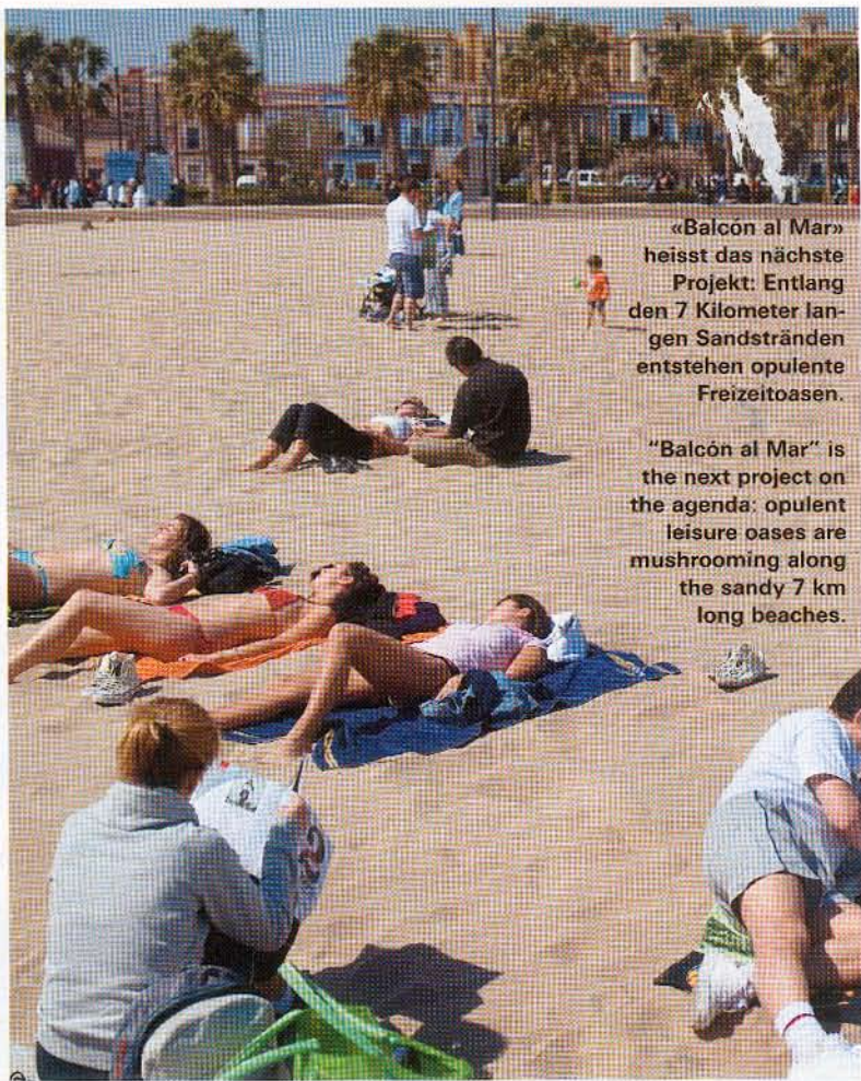
«Balcón al Mar» heisst das nächste Projekt: Entlang den 7 Kilometer langen Sandstränden entstehen opulente Freizeitoasen.